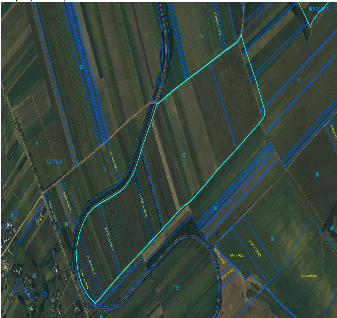
Fig. 2. Sector cadastral cu imobile înregistrate anterior lucrărilor cadastrului sistematic în lipsa planului parțel